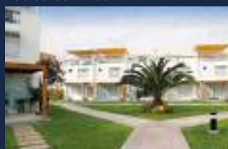
Asia del Sur = 2009