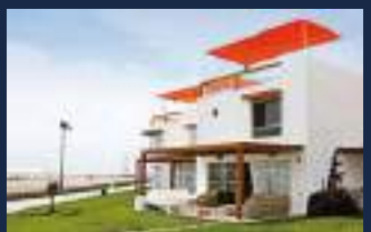
Asia Bonita = 2010