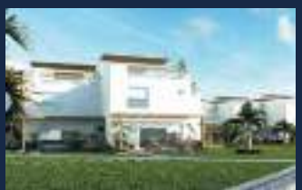
Kalani = 2020