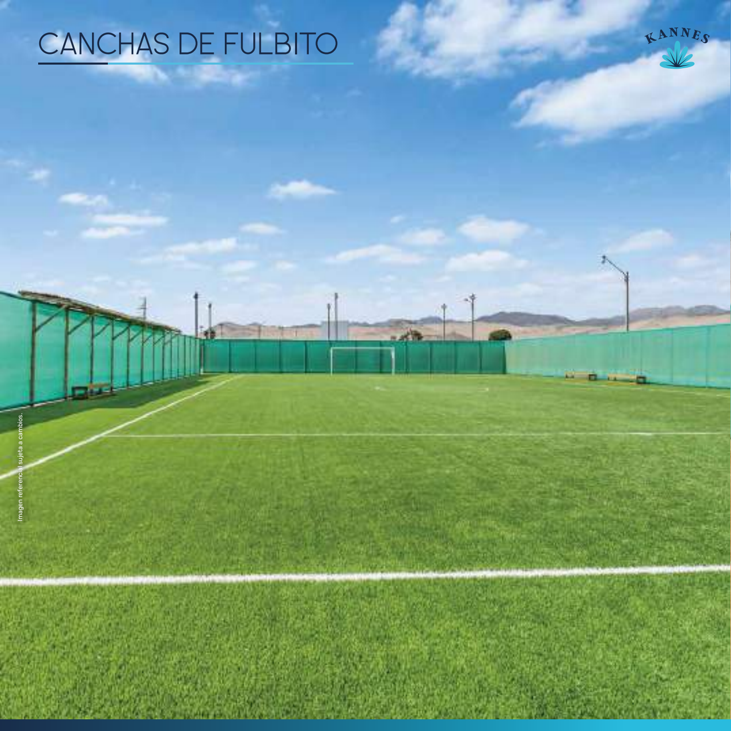
Imagen referencial sujeta a cambios.