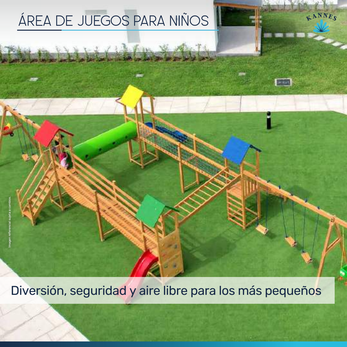
Imagen referencial sujeta a cambios.

Diversión, seguridad y aire libre para los más pequeños