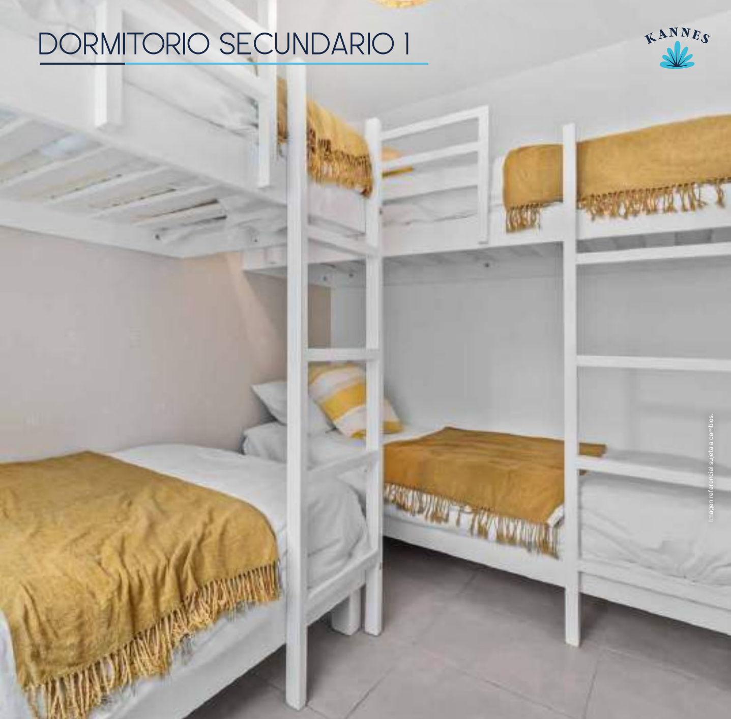
Imagen referencial sujeta a cambios.