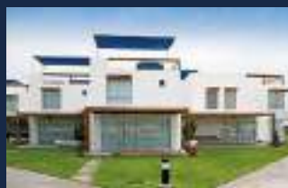
Asia Azul = 2010