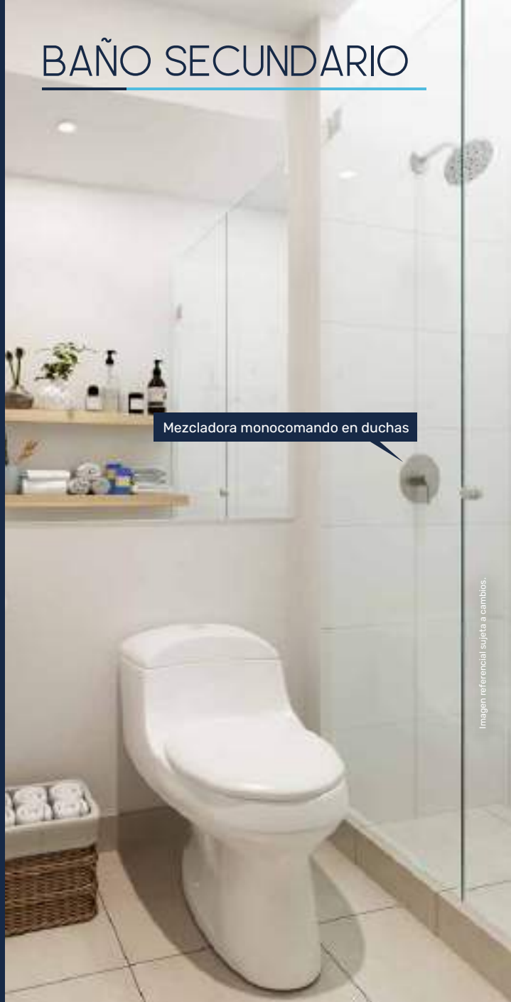
Mezcladora monocomando en duchas