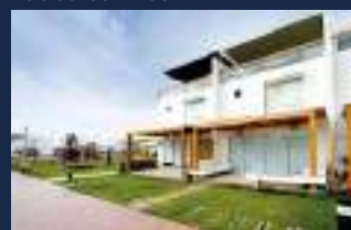
Asia del Sol = 2009