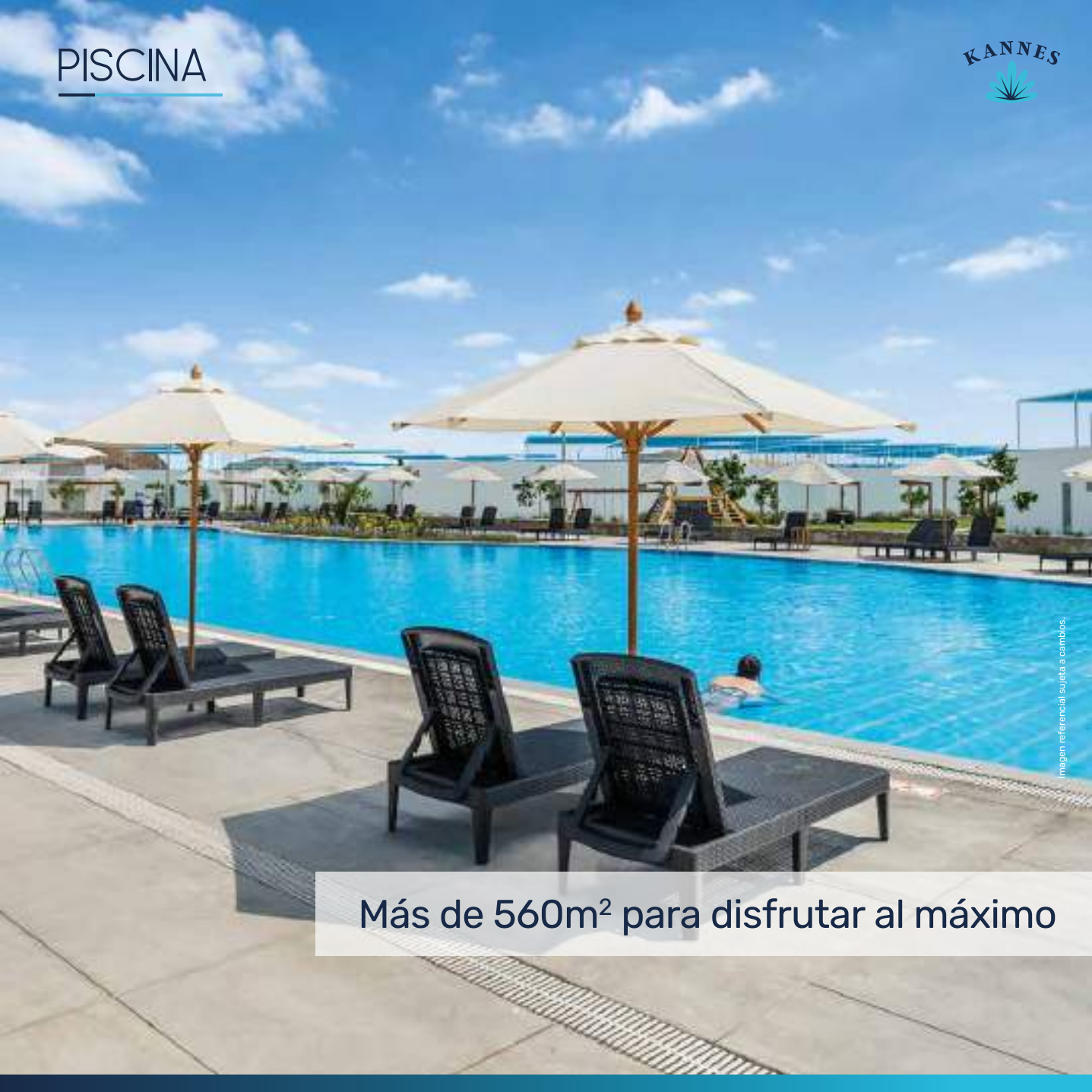
Imagen referencial sujeta a cambios.