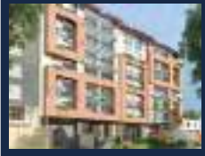
Lord Nelson - 2020