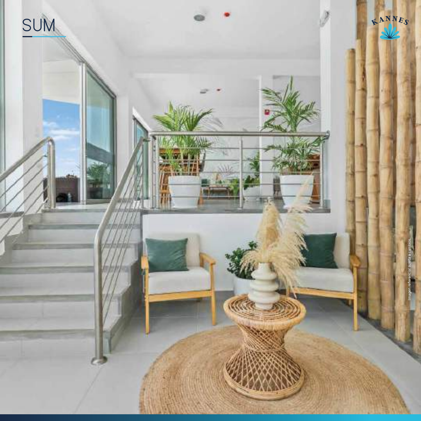
Imagen referencial sujeta a cambios.