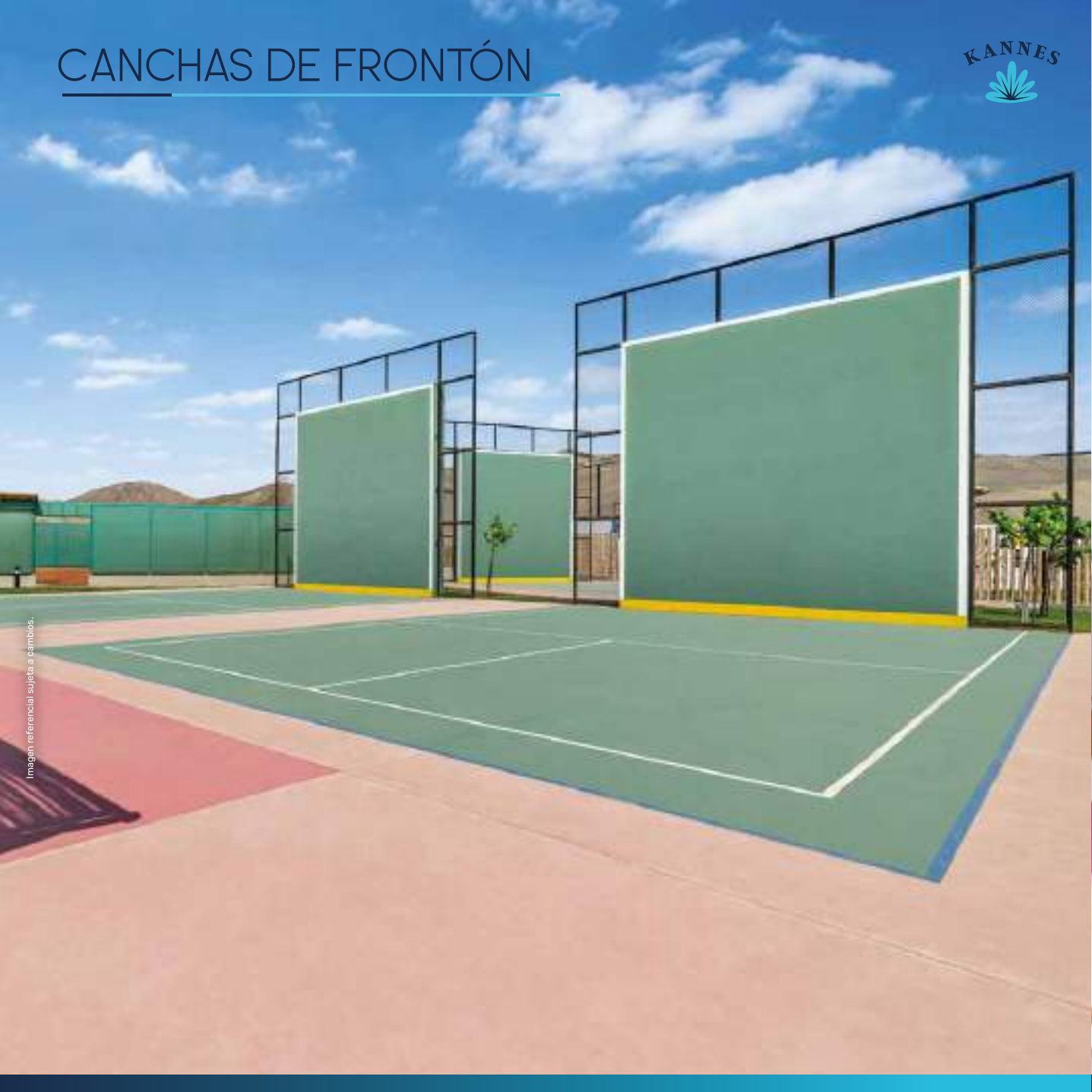
Imagen referencial sujeta a cambios.