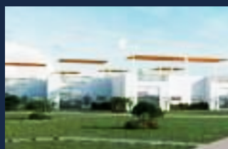
Kalúa = 2021