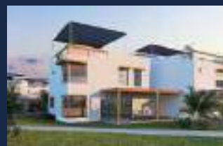
Kentia = 2019